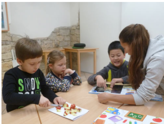
FOTO z klubů CID Pecka a Pecička, Družinky, Karlínských slavností dětí, Cidáčkových odpolední, výstav v Café Martin, akcí v hotelu Alwyn, akcí MČ Prahy 8, Karlínských trhů-Karlín Market, ad. (foto zde a v tiskových zprávách, v přílohách Akce roku)