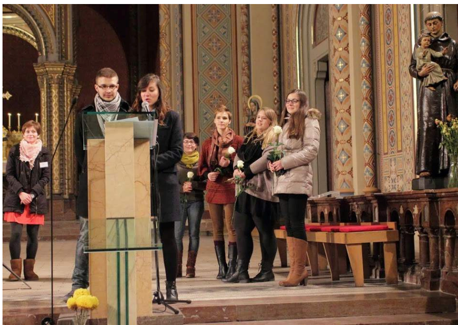
Benefiční koncert v Kostele Sv. Cyrila a Metoděje v Karlíně, 15.11.2013